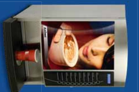
OptiVend 3 / 4 (TS) ▶

Uriek aan de OptiVend is de flexibel instelbare besturing. Dat maakt het mogelijk om de recepten voor warme dranken geheel naar eigen voorkeur in te stellen. De specifieke instellingen worden veilig opgeslagen met een pincode, zodat deze niet 'per ongeluk' te resetten zijn.