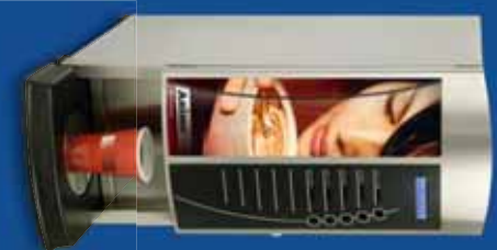
▶ OptiVend 1 / 2

Animo® levert de apparaten volledig geprogrammeerd. Installeren is dus gewoon een kwestie van plaatsen en aansluiten. Dankzij de voorgeprogrammeerde standaard instelling kunnen direct de lekkerste warme dranken worden getapt.