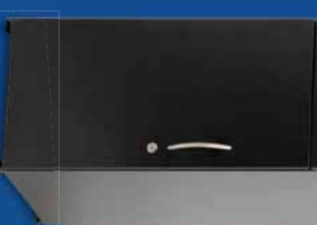
Onderkast (bovenblad optioneel) ▼