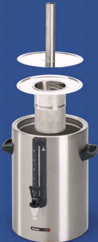
Voor het zetten van thee in een container plaatst u het speciale theefilter met vulpijp.