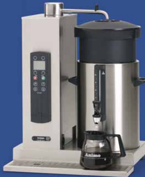
ComBi-line met een rechts geplaatste container van 10 liter: CB 1x10 R.