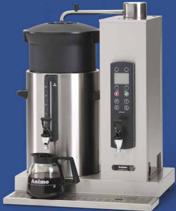
ComBi-line met een links geplaatste container van 10 liter en separate waterkoker in de zuil: CB 1x10W L.

Naast deze gebruikersinstellingen geeft het bedieningspaneel ook toegang tot de operator- en serviceomgeving. Deze laatste twee zijn alleen te bedienen met een pincode. U vindt er de instellingen voor het beheersen van het koffiezetproces, voor de gescheiden waterkoker en voor service en onderhoud.