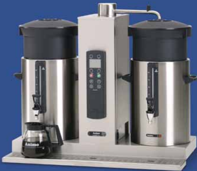
ComBi-line met twee containers van 10 liter: CB 2x10.

Animo's ComBi-line bestaat uit een combinatie van één of twee doorstroomwaterkokers en één of twee containers, die geplaatst kunnen worden op een buffet, werktafel of serveerwagen. In de juiste combinatie zet u zo heel gemakkelijk exact de hoeveelheid verse koffie of thee die u nodig heeft!