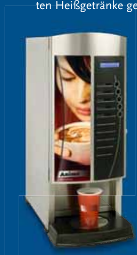
◀ OptiVend 1 / 2