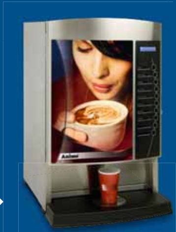
OptiVend 3 / 4 (TS) ▶