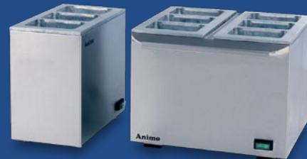
Tetrapackerhitzer geeignet für drei und sechs Tetrapack je ein Liter.