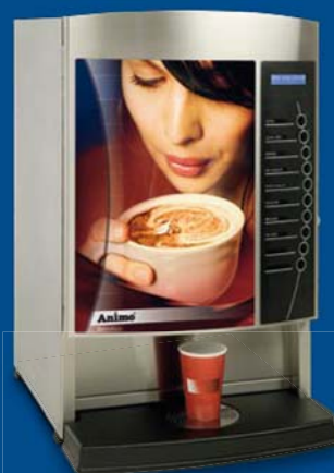
OptiVend 3 - 4 (TS)