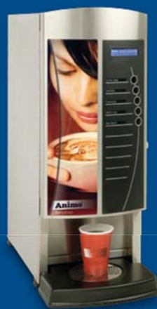
OptiVend 1 - 2

OptiVend se caractérise également par la possibilité de réglages sur mesure. On peut ainsi adapter les recettes de boissons chaudes aux goûts de chacun. Les réglages spécifiques sont protégés par un code personnel afin d'éviter une annulation involontaire ou malencontreuse.