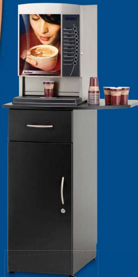
Table support avec rangement ▲