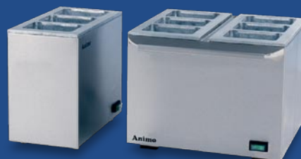
Chauffe-briques pour 3 briques. Système de chauffage à sec.